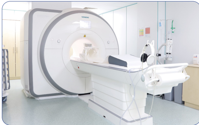
Im modernen 3-Tesla-MR-Tomographen wird die rund 40-minütige Untersuchung durchgeführt.

Liegt ein Krebsleiden der Prostata vor, so ist es essenziell zu wissen, wie aggressiv der Krebs ist. Bei dem Nachweis eines Tumors in der ultraschallgesteuerten Probenentnahme aus der Prostata bleibt unklar, ob tatsächlich der Tumoranteil mit der höchsten Aggressivität gefunden wurde – eine Tatsache die aber entscheidend für die Therapie und den weiteren Verlauf ist.